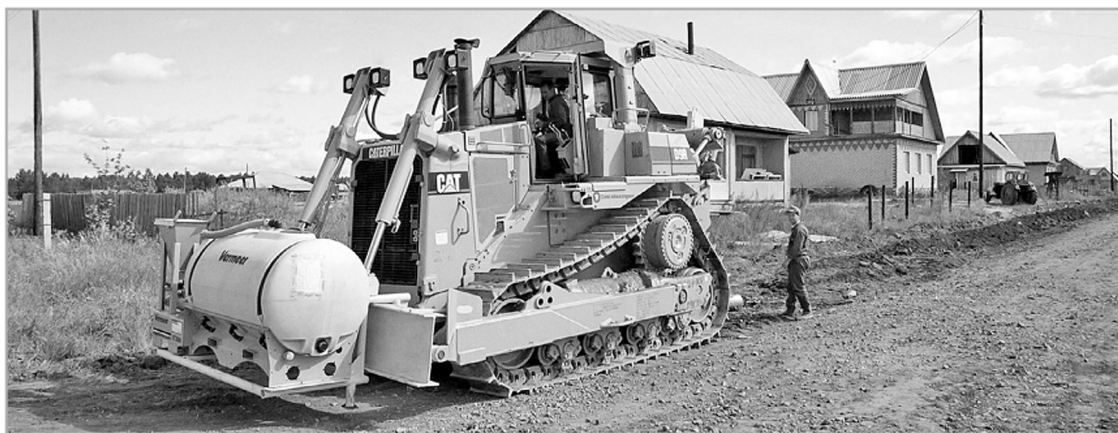
До конца 2017 года в тринадцати муниципалитетах будут построены новые объекты газоснабжения

Из 25 заявок, представленных муниципалитетами на конкурс по распределению субсидий, одобрены 24. Это объекты